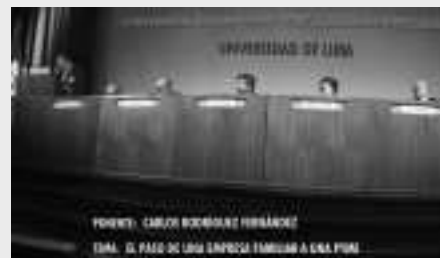
CONFERENCIA EN LA UNIVERSIDAD DE LIMA

Los contactos mantenidos, han sido muy satisfactorios y se han abierto importantes oportunidades de negocio en PERÚ, que servirán de punto de apoyo para la entrada del grupo Inzamac & Tecopy en dicho país.