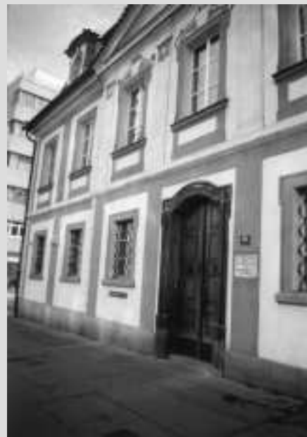
OFICINA COMERCIAL PRAGA