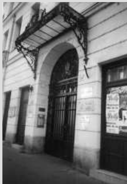
OFICINA COMERCIAL BUDAPEST