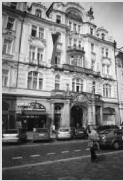
MINISTERIO DESARROLLO REGIONAL PRAGA